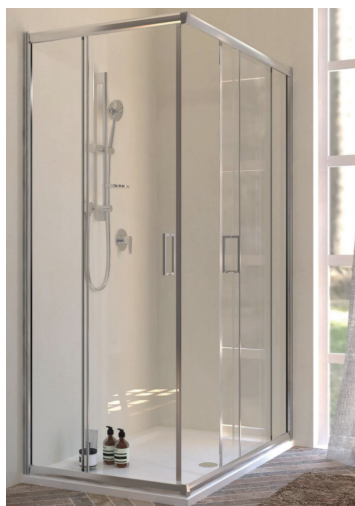
IMMAGINE PRODOTTO / PRODUCT IMAGE