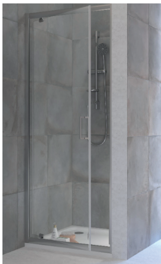
IMMAGINE PRODOTTO / PRODUCT IMAGE