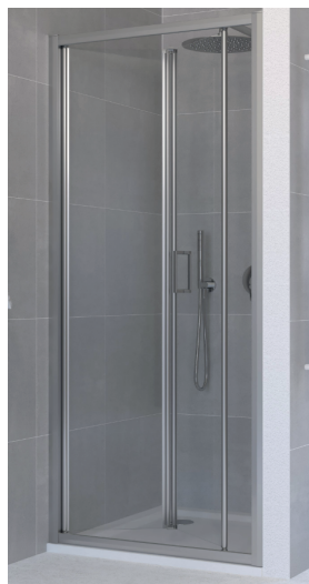
IMMAGINE PRODOTTO / PRODUCT IMAGE