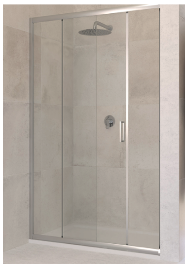
IMMAGINE PRODOTTO / PRODUCT IMAGE