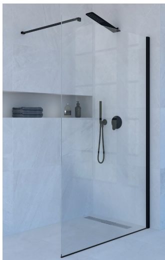
IMMAGINE PRODOTTO / PRODUCT IMAGE